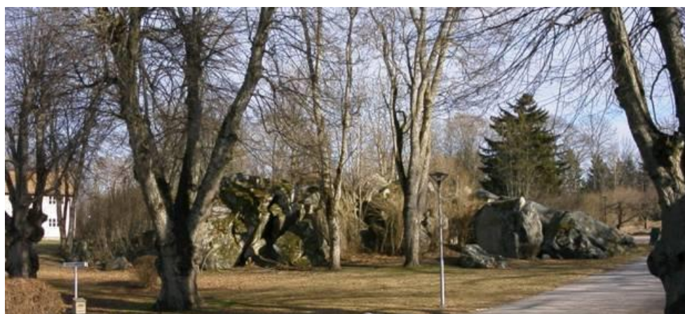
Stenblocken från norr