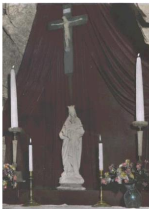
Vykort ”Interiör av Birgitta-grottan, Finsta”. Elliord Mattsson 1930 – talet.

Framför ett rött draperi på rummets södra vägg står ett altare med en Mariabild och på väggarna talrika konsoler med små statyetter, dekorerade vaxljus, ljusbärande putti, lampetter gjorda av paradplåtar till kaskar, blomstervaser m. m.