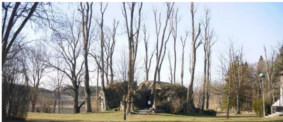
Flyttblocket från söder