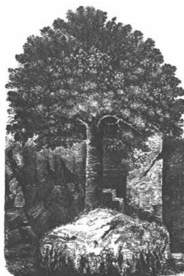
S:t Britas Bönkapell

”Hennes lefnad tillhör nu historien, och hennes födelseort skulle förutan henne länge sedan hafva varit glömd af häfden, om den icke såsom platsen för helgonets vagger vunnit en sådan. Den hade trampats af hennes fot och här hade hon för sin andakt invigt ett särskildt ställe, dyrbart för alla hennes beundrare, och dessa voro hela den katolska kristenheten.”